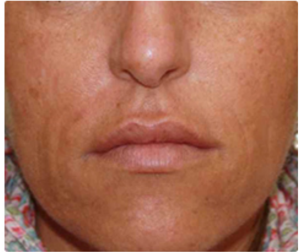
Nach der 2. Behandlung