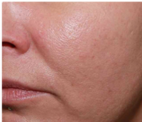
45 Tage nach der 1. Behandlung