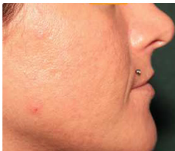
Nach der 2. Behandlung