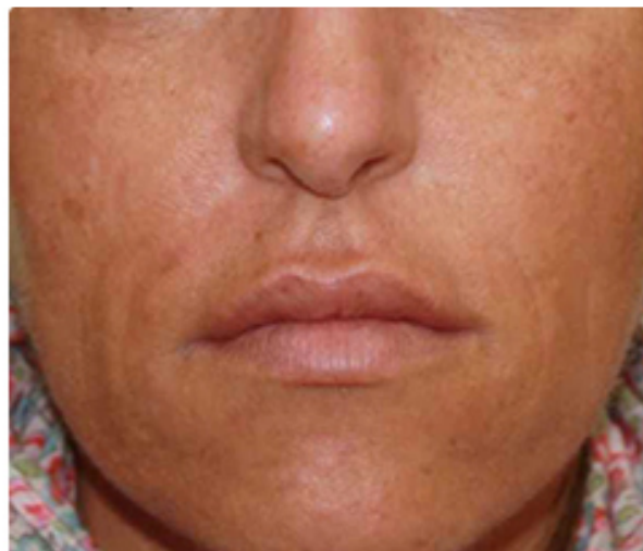
Nach der 2. Behandlung