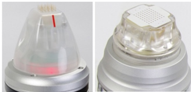
FRM (Fractional RF Microneedle) FRS (Fractional RF Sublative)

Die Wirkung dieser einzigartigen Methode ist wissenschaftlich nachgewiesen. Die Vorteile von Meso-Therapie und der Radiofrequenz vereint das RF Micro Needling Dual-System Cellina PR. Winzige Nadeln dringen bis in eine genau definierte Hauttiefe vor und geben dort kurze Impulse ab. Ein Vorteil ist die hohe Behandlungskontrolle über die Frequenz und Eindringtiefe der 25 goldenen Nadeln bis auf 0,1 mm genau und je nach Hauttyp eingestellt werden kann.