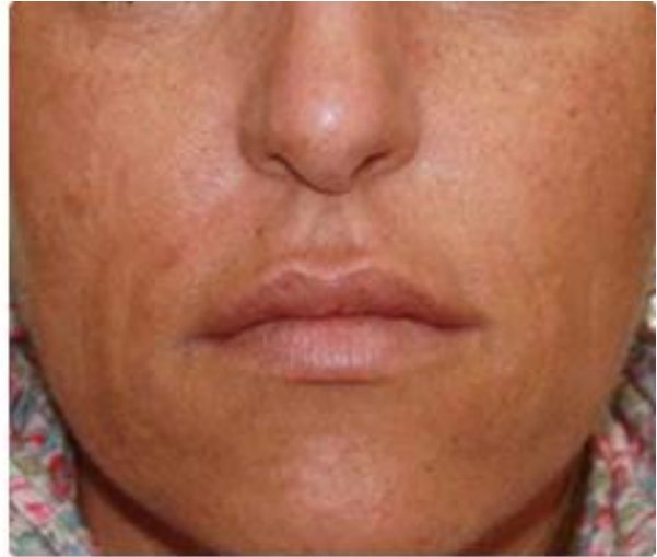
Nach der 2. Behandlung