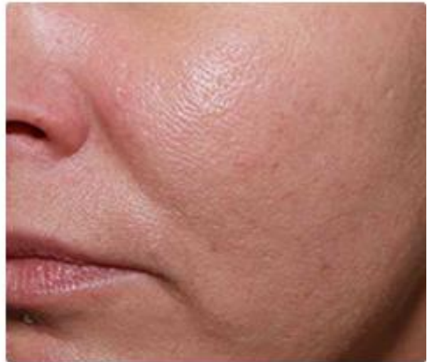
45 Tage nach der 1. Behandlung