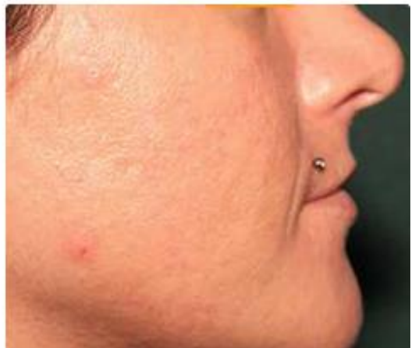
Nach der 2. Behandlung